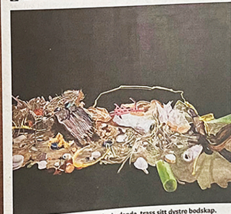
Morild sine måleri er vakre og innbydande, trass sitt dystre bodskap.