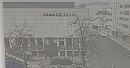
Sentralbadet blir en byggeplass i flere år når vaksinstasjonen flytter ut 1. mars.

De nye kulturhusene i Sentralbadet og på Dikkedokken blir ytterligere forsinket.