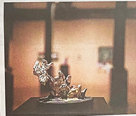
15 tonn plast endar i havet kvart minutt.